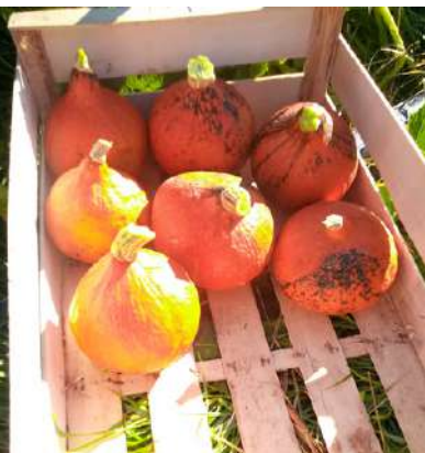
Red Kury MSP Graine des Montagnes