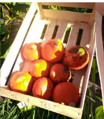
Potiron Potimarron Sainte Marthe