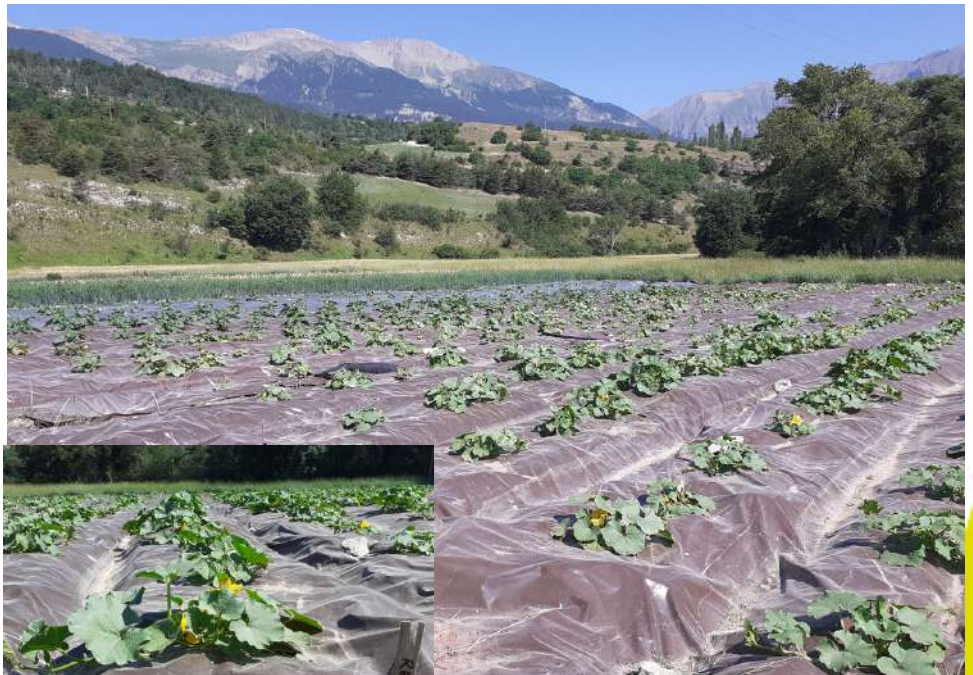
26 juin 2023 : Parcelle de réalisation de l'essai