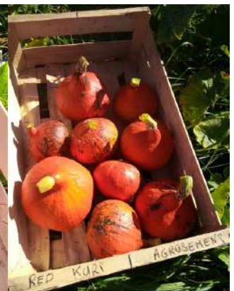
Red Kury Agrosemens