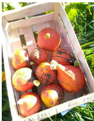
Ushiki Kuri Agrosemens