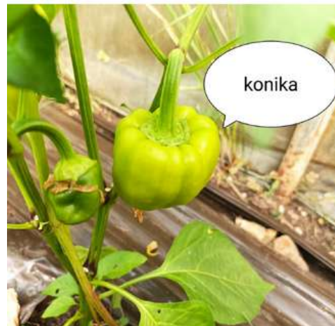
Konika le 18.07.23