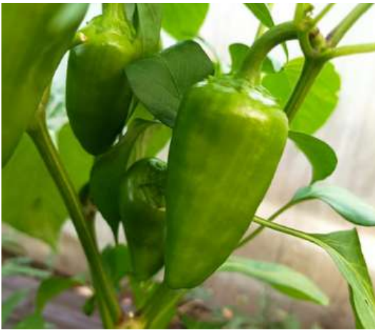
Nante5 le 18.07.23