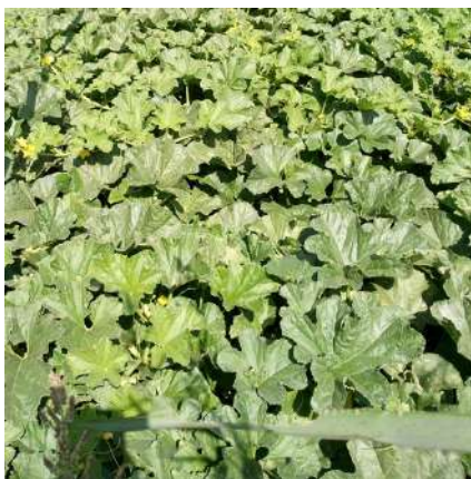
Védrantais du roc

L'essai porte sur 2 variétés de melons : - Védrantais du roc (Germinance et Agrosemens). - Diamex (Germinance).