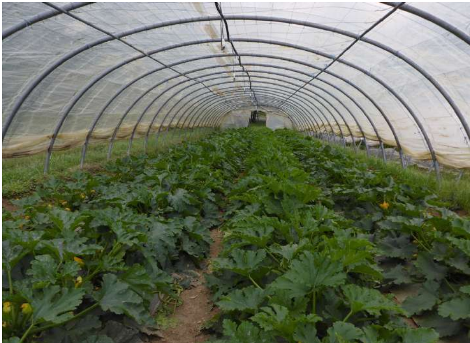
5 juin 2023 : parcelle de l'essai