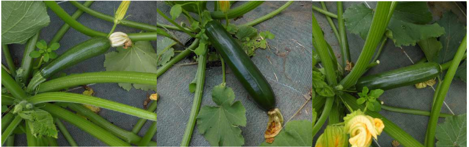
5 juin 2023 - de gauche à droite : zuboda - caravaggio - black beauty