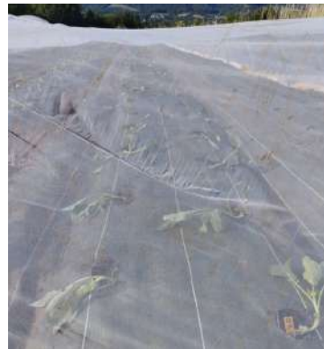
Plantation sous filet, Les jardins de la Roche – 4 juillet