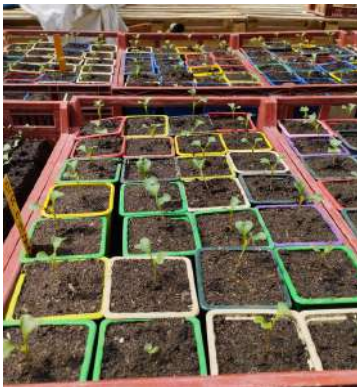
Repiquage des plants en pépinière – 15 juin