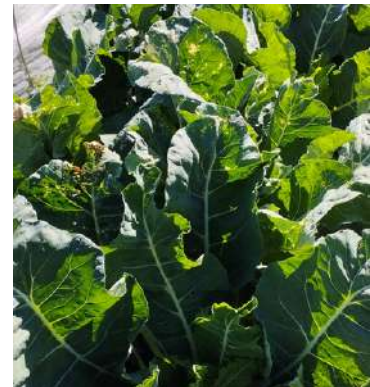
En culture, les feuilles proches des filets sont brulées – 1 septembre