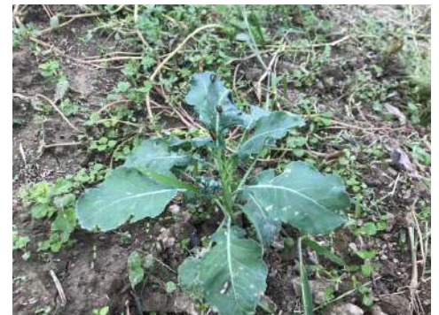
En cours de production – 14 septembre