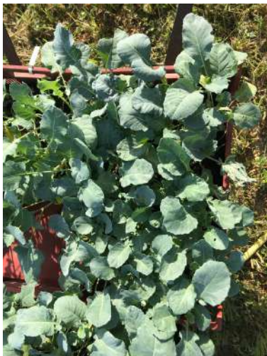
Plants le jour de la plantation – 8 juillet