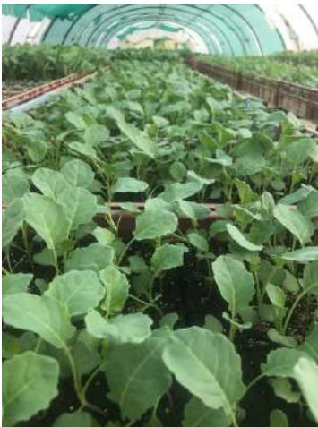
Plants en pépinière - juin