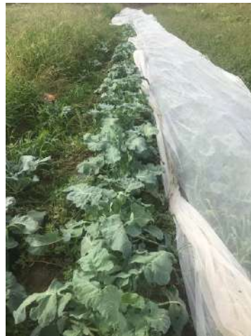
En cours de production - septembre