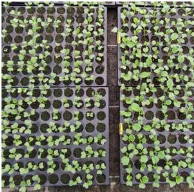
Semis le 15 juillet

L'essai porte sur 2 variétés population de choux brocoli comparées au Belstar F1: Rasmus (Germinance), Rasmus (Sativa)