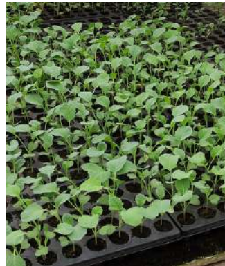
Plantation sous filet, le 11 août