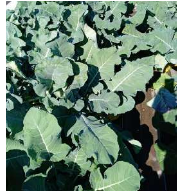
En culture, le 6 octobre