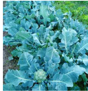
En culture, le 6 octobre