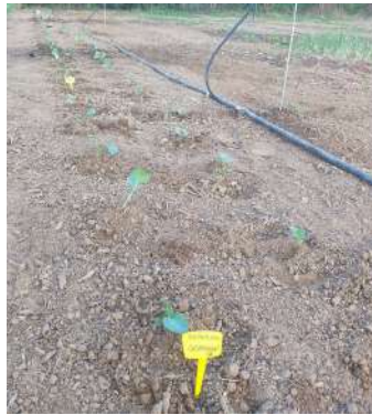
Plantation le 3 août