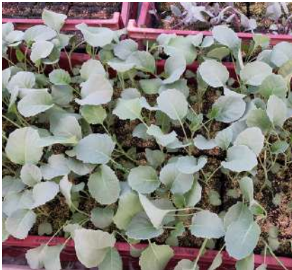
Semis le 13 juillet

L'essai porte sur 2 variétés population de choux brocoli comparées au Belstar FI: Rasmus (Germinance), Rasmus (Sativa)