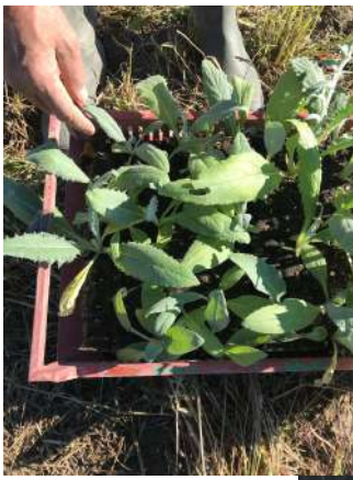
Plants chez Korban HASSANI, le 7 octobre