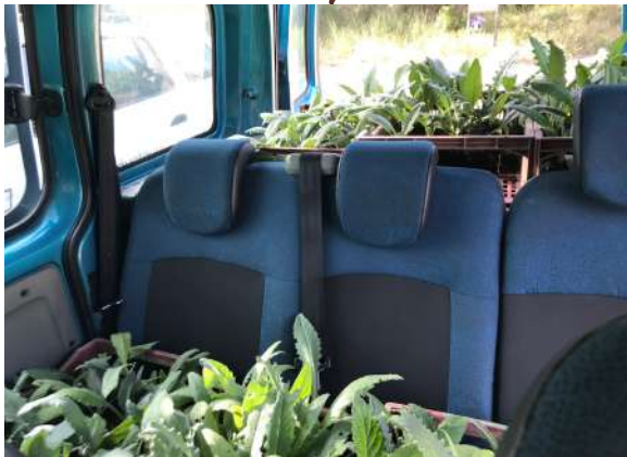
Récupération des plants le 30/09/2021